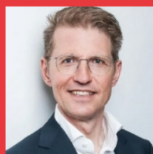
SANDER DEKKER, VOORMALIG STAATSSECRETARIS OCW